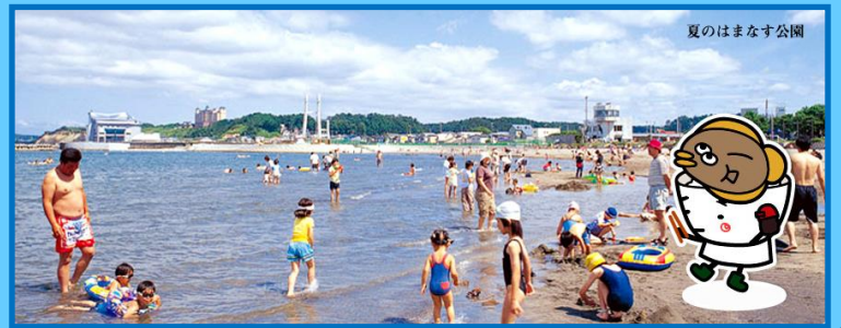
夏のはまなす公園

「海が見たい！」と、利用者さんからも人気のあるコースで、潮風を感じながら、新鮮な海の幸を楽しめます。