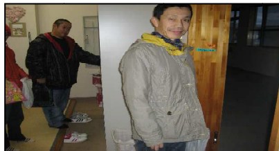
買い物場所は館内撮影禁止なので、外出前後のメンバーの楽しそうな様子の写真を掲載させて頂きました。